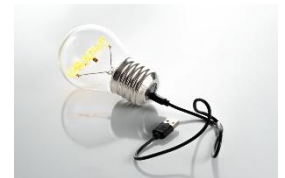
<お買上げプレゼント イメージ>

期間中、「GRAPHT GAMING STYLE 展」にて税込11,000円以上商品をお買上げの皆さまに USB 充電式 GRAPHT THE GENIUS LAMP をプレゼントいたします。