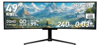
<49インチスーパーウルトラワイドモニター>