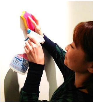
アイテムをとりそろえました。