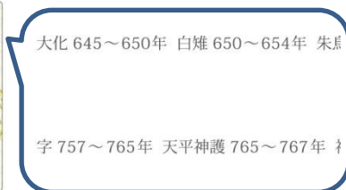
元号：罫線イメージ