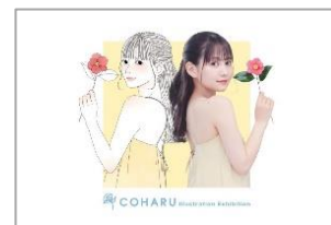
<ポストカード イメージ>