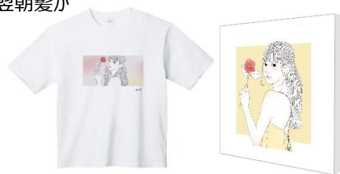
<オリジナルグッズ イメージ>