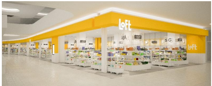
＜ 下関ロフト 店舗イメージ ＞

売場面積は約243坪(約802㎡)、ロフトで最も多く展開しているスタンダードな店舗規模です。ワンフロアの買い回りしやすい最新のレイアウトにて、トータルでおよそ18,100種類を品ぞろえ、文具雑貨(8,500種類)、健康雑貨(6,000種類)、バラエティ雑貨(2,600種類)、生活雑貨(1,000種類)の4領域で、市(旬)と蔵(定番)の商品を展開いたします。