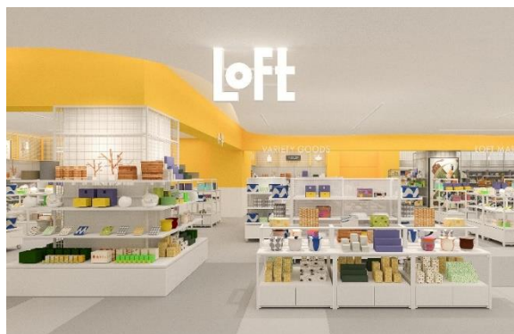
< 新宿三丁目ロフト 店舗イメージ >

また、新宿の街の賑わいを、ネオン管をイメージしたデザインで「新宿三丁目ロフト」のオリジナルポスターやビジュアルデザインで鮮やかに彩ります。