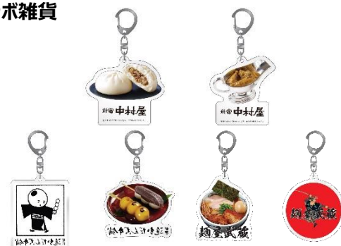
< アクリルキーホルダー >