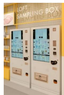
< ロフボ イメージ >

「ロフボ」は、ロフトアプリ会員向けに新商品の試供品を提供 するサンプリング専用自動販売機。利用者データをサンプル 提供取引先やロフトのマーケティング分析の活用につなげて いく「リテールメディア」の取り組みの一環として、2 台のロフボ を設置します。渋谷ロフト、銀座ロフト、梅田ロフトに続き、 4 店舗目。