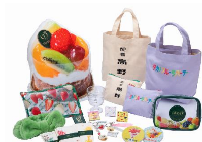
< ロフトフルーツパーラー >