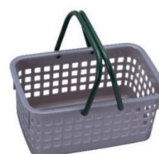
< 小サイズカゴ >

ロフト全店舗で行っている使用済み化粧品の空き容器回収「ロフト グリーン プロジェクト リサイクルプログラム」で回収したプラスチック材のリサイクル活用として、 再生素材を 5% 配合したお客さまお買い物用「小サイズカゴ」を、銀座ロフト、 梅田ロフトにつづき、新宿三丁目ロフトでも使用を実施します。