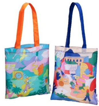
< ロフトオリジナルトートバッグ >

11 月 21 日(金)より「新宿三丁目ロフト」で合計税込 2,500 円以上お買上げのお客さま先着 3,000 名さまに「ロフトオリジナルトートバッグ」をプレゼント。