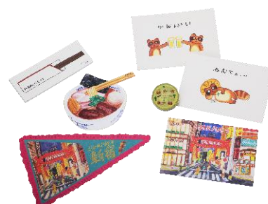
< ペーパーメッセージ >