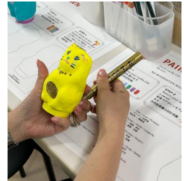
<イベントイメージ>

にて受付。「希望日時・参加人数・お名前・電話番号」をお伝えください。※先着順 ※詳細は銀座ロフト公式 HP( https://www.loft.co.jp/ginzaloft/ )でお知らせします