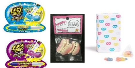
<2018 グミアワード第1位商品> *今年もノミネートされています