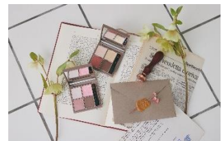
< Ririmew インザミラーアイパレット >