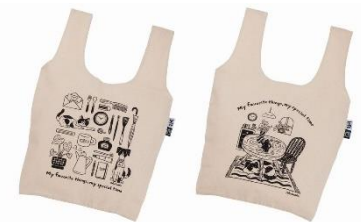
< ロフトオリジナル おかひものバッグ >