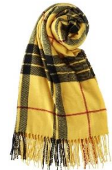
< カシミアタッチストール >