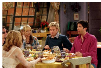
<当時ジェニファー・アニストンの夫ブラピがゲスト出演>

「フレンズ」とは: 1994年9月から2004年までアメリカNBCで全10シーズン放送。NYを舞台に男女6人のライフスタイル、友情、恋愛をユーモアたっぷりに描いたコメディ作品で、生きた日常会話が学べると英語を学ぶ若い世代を始め世界中で愛された伝説のドラマシリーズ。★フレンズ25周年最新情報は、 WB公式サイト URL: http://bit.ly/friends_25th