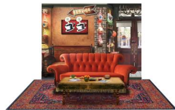
<写真① フォトスペースイメージ>