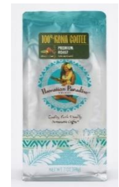
<100%コナプレミアムロースト 豆>