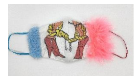
ショウジョノモ 「デコレーションカラージュマスク」5,940円

2020年夏にデビューした、大阪・堺の染工場ナカニが手がける神出鬼没のB反専門店「大阪屋」の「さらしマスクキット」が登場、にじゆらの「さらしマスク」各種も。