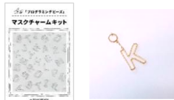
iki のプログラミングビーズキット(金・銀)1,320円