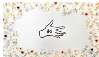
iki マスクチャーム即売会 1,870円～

※このリリースの情報は2021年1月現在のものです。内容等は変更になる可能性があります。