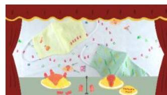
とみこはん はんこスタジオ