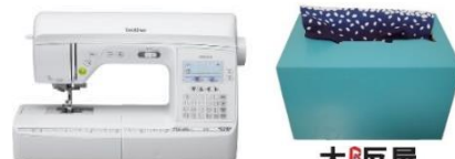
ブラザーミシンスタジオ 1,100円/60分