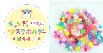
キャンディマスクホルダーキット 1,650円