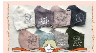
ナガキパーマ手描きマスク即売会 2,530円～