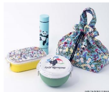
<KEITA MARUYAMA ランチシリーズ>