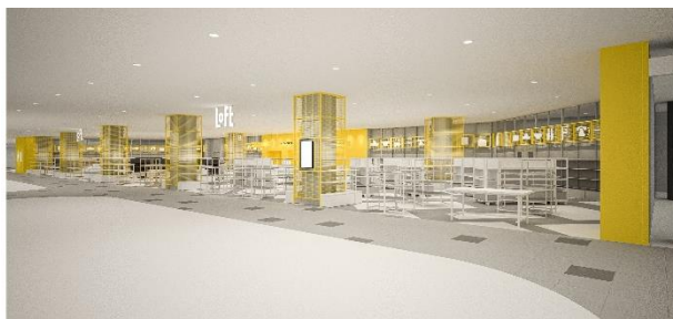
<金沢ロフト 店舗イメージ>

営業面積は 175坪(約 579㎡) とロフトではスタンダードな規模で、ワンフロアでコンパクトな買いまわりのしやすい店舗タイプです。トータルでおよそ 15,100種類 を品揃え、 文具雑貨(7,500種類)、健康雑貨(5,500種類)、バラエティ雑貨(1,500種類)、生活雑貨(600種類) の4領域で、市(旬)と蔵(定番)の商品で構成しています。