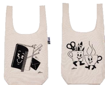
<ロフトオリジナル おかいものバッグ>