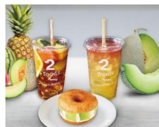
<2foods 夏の新作メニューイメージ>

※このリリースの情報は2021年7月現在のものです。商品内容・価格等は変更になる可能性があります。