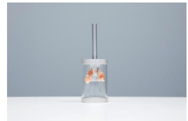
<中島重久堂 鉛筆削り>

1933年創業の株式会社中島重久堂は、国内唯一の小型鉛筆削り専門の製造業です。大阪の地で80年以上、鉛筆削りの刃、ボディー、セットまでを自社工場で一貫生産しています。「鉛筆削りを通じて、文化創造に貢献する」というミッションに基づき、ペンシルフレックやペンシルフレックアートとともに、モノだけでなく空間やコトについて文創具ブランドらしい発信を続けています。