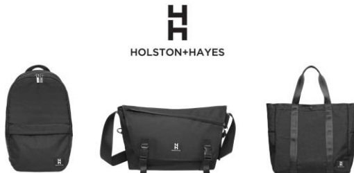
<ホルストンアンドヘイズ>

D.I.Y.をコンセプトにNYブルックリンで誕生したアクセサリブランド。既製品を中心に一部カスタムパーツも展開し、オリジナルアクセサリの作製も可能。