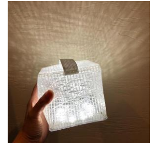
<CARRY THE SUN>

小物入れと充電ドックが一体になった、普段使いができるデスク型モバイルバッテリー。いざという時は、コンパクト設計された充電ドックだけを持ち出す事ができます。