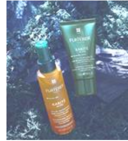
<ルネフルトレール>