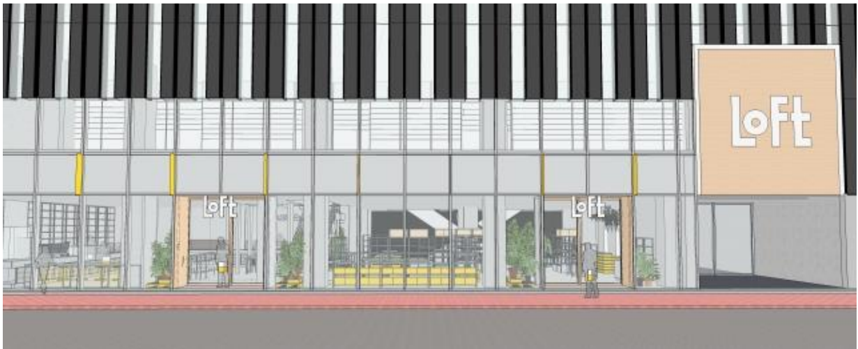
<増床後銀座ロフト外観イメージ図>

ロフトとして初めての「食」に関わる取組みや「日本」の伝統的な物づくりの技と現代の新規性を織り交ぜ、世界的課題である環境への配慮や「サステナブル」を踏まえたコンテンツを様々な角度より発信・提案致します。