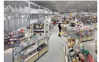
<クランク導線イメージ>

ロフトの売場は、お買い物時間を楽しむことを意図したクランク導線(導線がジグザグした回遊性が高まる売場)を採用しています。お客さまがお気に入りの商品を選ぶために店内を回遊する中で、各所に設けた編集提案拠点では、新商品や旬の商品、新しい使い方等の発見が待っています。店内案内には、わかりやすい新柱サインも導入しました。