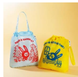
< ロフトオリジナル おかいものバッグ >