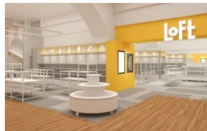
< 上大岡ロフト 店舗イメージ >

美容・健康雑貨 6,000種類 、文具雑貨 9,800種類 、バラエティ雑貨 4,300種類 、生活雑貨 1,700種類 の4領域にて、市(旬)と蔵(定番)の商品を展開いたします。