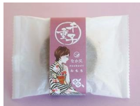
<なか又 和もち 千重子オリジナル帯パッケージ>